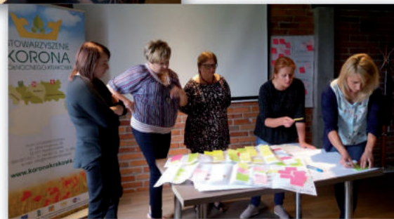
Zdjęcia ze szkoleń i wizyty studyjnej w Koszęcinie